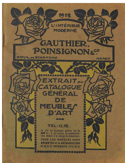
Couverture du catalogue de 1912

Successivement, employé, dessinateur de compositions ornementales, concepteur de mobilier, entrepreneur ébéniste indépendant, artiste industriel, propriétaire et directeur de société, la multiformité de ses activités professionnelles, sociales comme individuelles, permet de retracer le portrait d'un homme atypique et attachant dont le parcours et les productions témoignent d'une personnalité singulière désireuse de mettre son art à la portée du plus grand nombre.