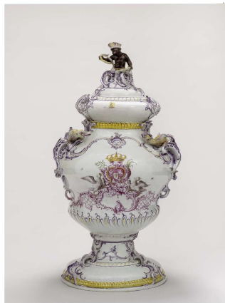
Niderviller - PDLML - JY. Lacôte

À la faveur du 40 e anniversaire de l'inscription à l'Unesco des 3 places XVIII e de Nancy, le musée consacre une exposition à l'architecture et à la fonction de la place Stanislas au milieu du XVIII e siècle. En philanthrope éclairé soucieux de favoriser la diffusion des idées nouvelles et les progrès de la connaissance, Stanislas installe dans les pavillons qui bordent la place Royale et encadrent théâtralement la statue de son gendre Louis XV plusieurs fondations prestigieuses : la Bibliothèque royale en 1750 la Société royale des sciences et belles-lettres en 1751, le Collège royal de médecine accompagné d'un jardin botanique en 1752, une nouvelle salle de Comédie en 1755. Le véritable microcosme des Lumières que représente la place Royale est évoqué à travers une sélection d'œuvres provenant majoritairement des riches collections du palais des ducs de Lorraine – Musée lorrain.