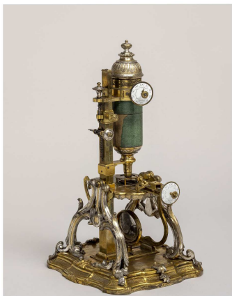
Microscope - PDLML - JY. Lacôte