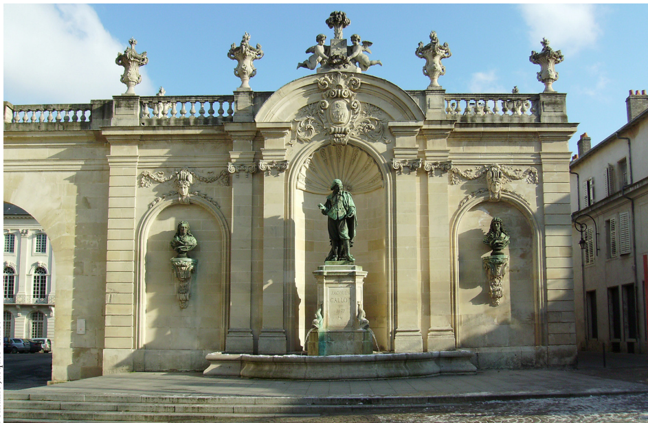
Fontaine Jacques Callot

Les fontaines monumentales ont forgé et forgent toujours le paysage urbain. D'ailleurs, on en construit encore aujourd'hui, preuve qu'elles ont toujours su dépasser leur simple rôle de fournisseur d'eau.