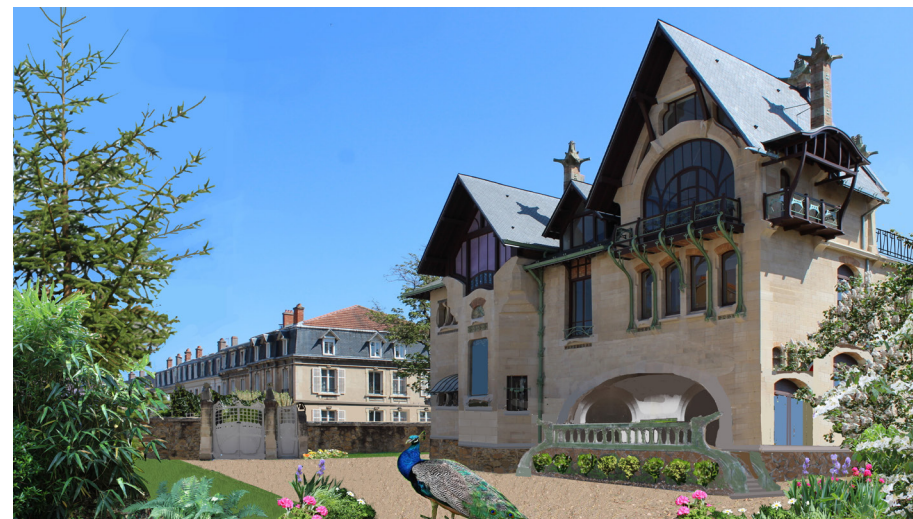
La Villa Maïorelle avant la vente et le lotissement de son parc dans les années 1930 (montage photographique).

Depuis le lapin est sorti de son terrier avec un élargissement des thèmes abordés et de son public, qui déborde l'agglomération nancéienne.