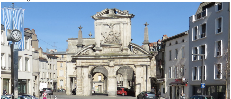
Place des Vosges en 2013

Témoignage éminent de l'histoire ducal, classée à ce titre aux Monuments historiques, la porte Saint-Nicolas fut confrontée, comme les autres portes, aux contraintes et aux exigences de la modernité et de l'extension urbaine extra muros de Nancy, à partir du XIXe siècle. Comment, et à quelles conditions la porte fut-elle maintenue et préservée ? En quoi les métamorphoses subies, à plusieurs reprises, par la porte Saint-Nicolas et son environnement à partir du milieu du XIXe siècle témoignent-elles des débats et des compromis dans les enjeux de préservation du patrimoine versus les politiques d'aménagement urbain ?